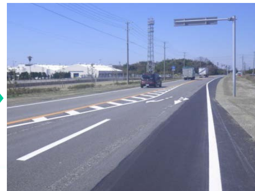
右折車線の延伸や路肩の整備後