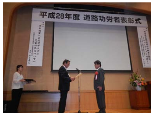
県道路協会副会長より表彰状が贈呈