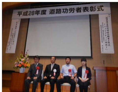
受賞者の皆さまによる記念撮影